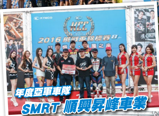
年度亞軍車隊 SMRT 順興昇峰車業