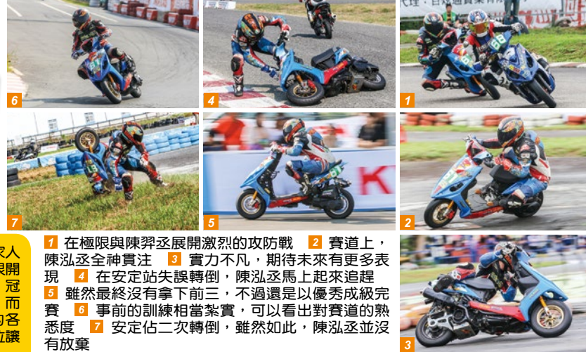
1 在極限與陳羿丞展開激烈的攻防戰 2 賽道上，陳泓丞全神貫注 3 實力不凡，期待未來有更多表現 4 在安定站失誤轉倒，陳泓丞馬上起來追趕 5 雖然最終沒有拿下前三，不過還是以優秀成績完賽 6 事前的訓練相當紮實，可以看出對賽道的熟悉度 7 安定佔二次轉倒，雖然如此，陳泓丞並沒有放棄