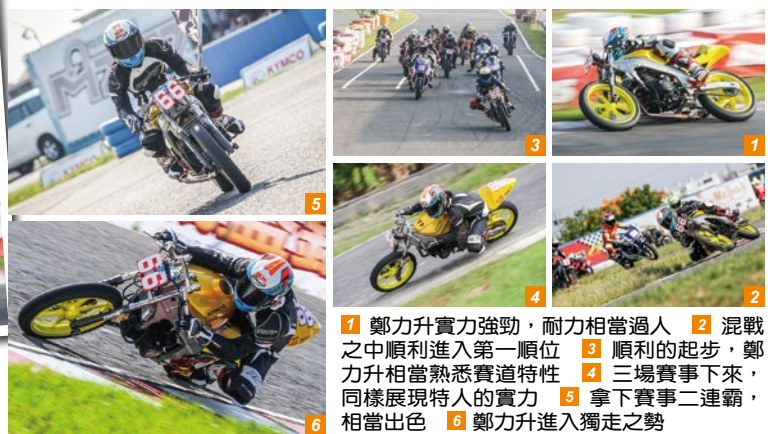
1 鄭力升實力強勁，耐力相當過人 2 混戰之中順利進入第一順位 3 順利的起步，鄭力升相當熟悉賽道特性 4 三場賽事下來，同樣展現特人的實力 5 拿下賽事二連霸，相當出色 6 鄭力升進入獨走之勢

這年比賽相當吃力，自己報名許多組參賽，體力消耗相當大，不過好險有控制好自己的節奏，感謝車隊以及朋友支持與協助，讓我成這次拿下佳績。