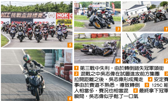
1 第三戰中失利，由於轉倒錯失冠軍頭銜 2 混戰之中吳志偉在試圖進攻前方集團 3 拉開距離之後，吳志偉形成獨走 4 安定賽事由於賽道不熟悉，導致轉倒 5 125C組人相當多，賽況也相當混 6 最終拿下冠軍瞬間，吳志偉似乎鬆了一口氣