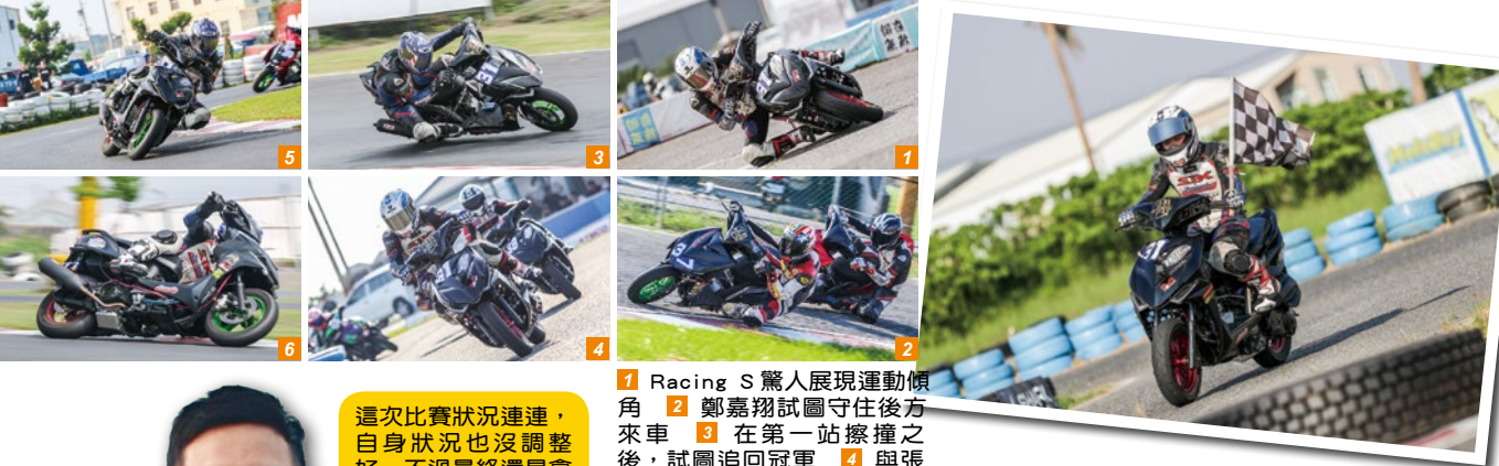
1 Racing S驚人展現運動傾角 2 鄭嘉翔試圖守住後方來車 3 在第一站擦撞之後，試圖追回冠軍 4 與張証堯展開攻防，試圖甩開他 5 最終成功甩開，進入獨走狀態 6 今年鄭嘉翔苦戰連連，不過還是奪下年度車手