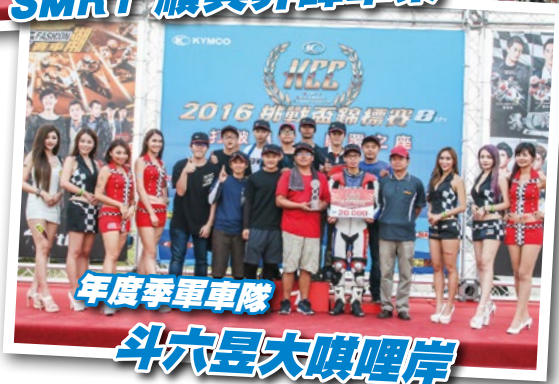
年度季軍車隊 斗六昱大吡哩岸